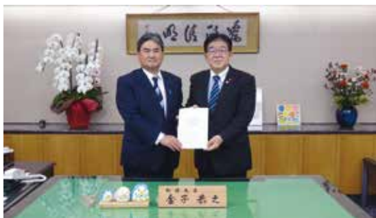
本県選出の金子総務大臣へ要望書手交

また、翌日には令和4年度の政府予算等に関する提案・要望書を、林野庁の天羽(あもう)長官へ手交し、予算概算要求の満額獲得に向けての要請を行った。