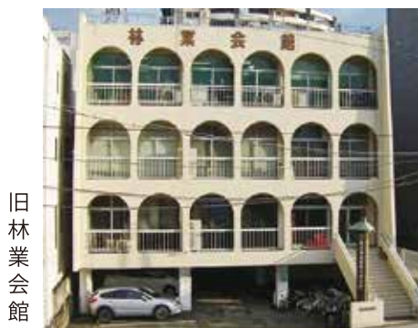
旧 林 業 会 館