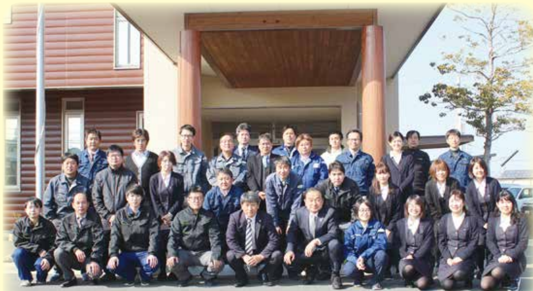
熊本県森林組合連合会 (34名)

地域森林の適切な利用・保全と林業経営の 更なる発展に向けて 役職員一同頑張っています