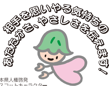
熊本県人権啓発 マスコットキャラクター 「ココロ」