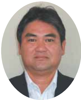
熊本県森林組合連合会 代表理事会長