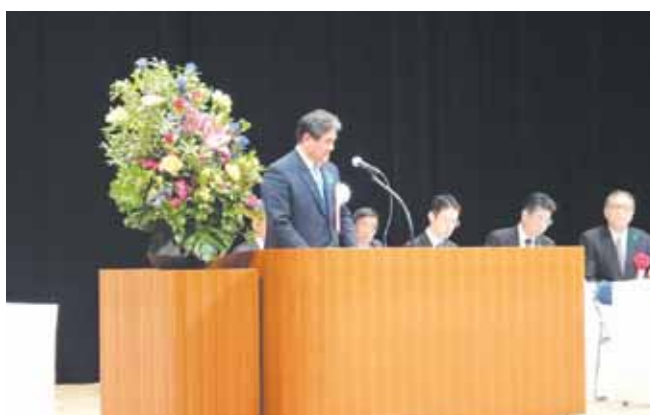
前川熊本県森連会長の閉会挨拶